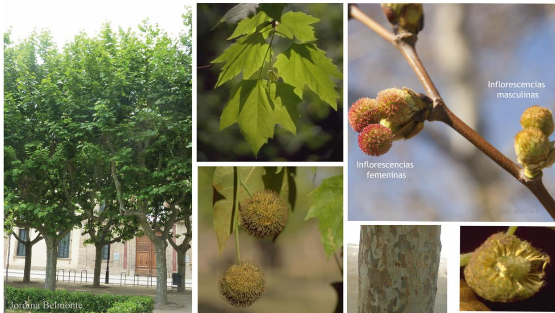
Fig. 1. Visió general d'un passeig urbà amb plàtans d'ombra i detalls de la fulla, les inflorescències masculines i femenines i (a baix) del fruit, de l'escorça del tronc i d'una inflorescència alliberant pol·len.

És una planta habitual a l'entorn urbà i urbanitzat, plantat a carrers, passeigs, parcs i jardins. També està present als marges d'algunes carreteres i camins i creix a la vora d'alguns rius. També hi ha algunes plantacions forestals.